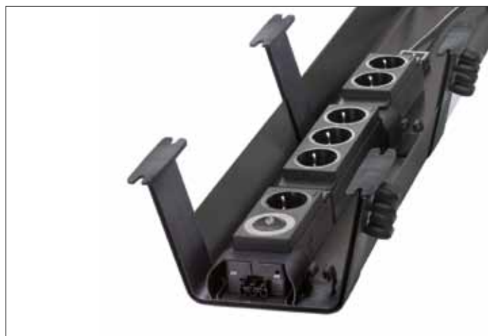
Rail für den EVoline Express, feste Montage