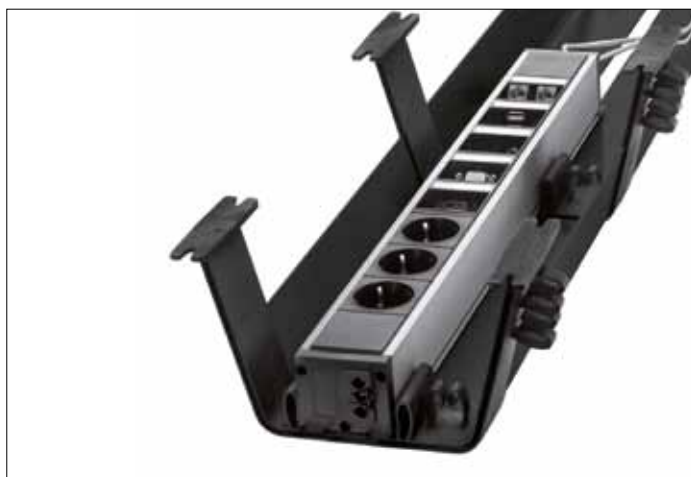
Rail für den EVoline U-Dock, verschiebbar